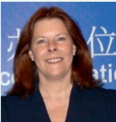
Propuesta de Michele Patterson, Presidenta de la AIIT, junio de 2008